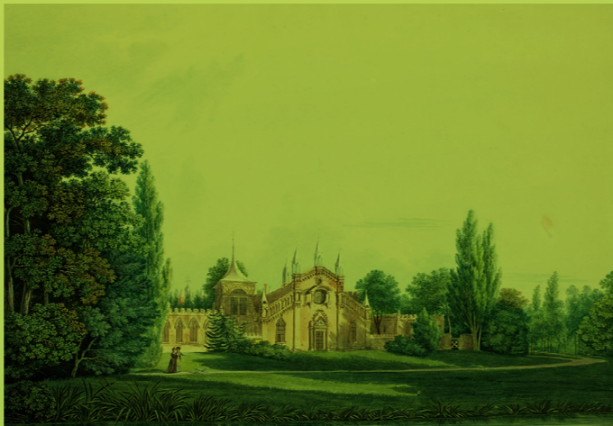
Das Gotische Haus zu Wörlitz · Dom Gotycki w Wörlitz · The Gothic House at Wörlitz, Radierung · rycina · etching, C. Kunz, Dessau 1797

Titel: Pierwsza strona · Front Page: Plan des Gartens von Pożóg · Plan of the Garden of Pożóg, aus- w- in: Izabela Czartoryska, Mancherlei Gedanken über die Art und Weise, Gärten anzulegen · Myśli różne o sposobie zakładania ogrodów Various thoughts on manner and ways of planting gardens (1808, dt.)